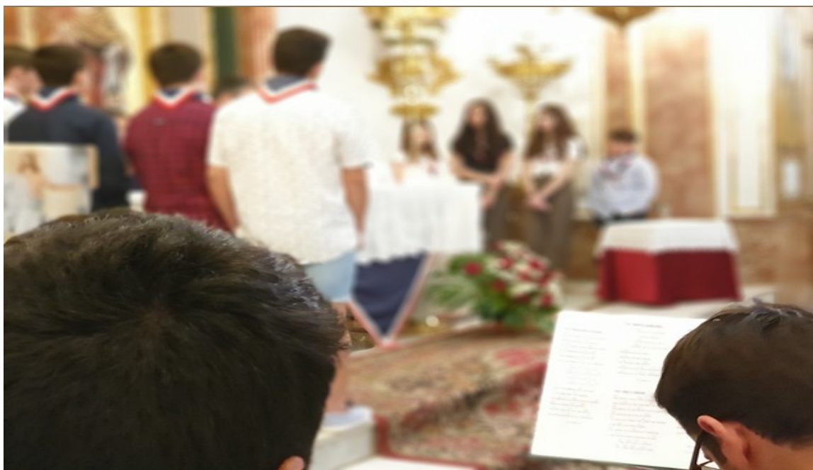
Celebración de Ritos Juniors en una de las Parroquias