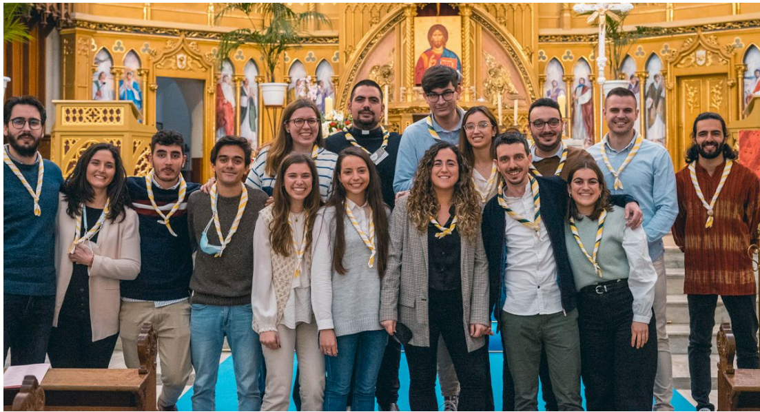
El Equipo Diocesano con la pañoleta que le identifica y simboliza.