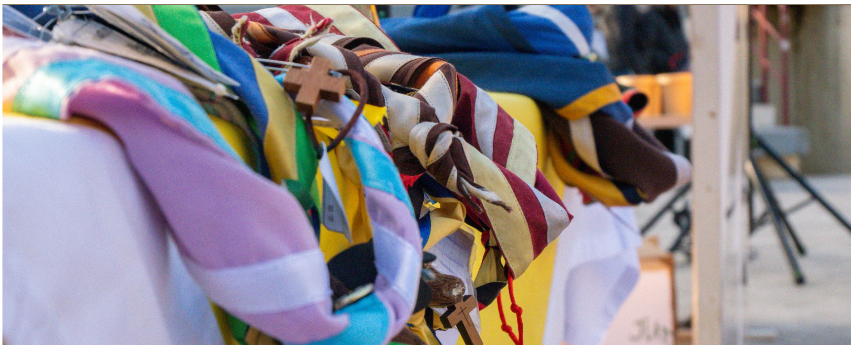
Pañoletas en el Festival de la Canción de la Vicaría I y II.